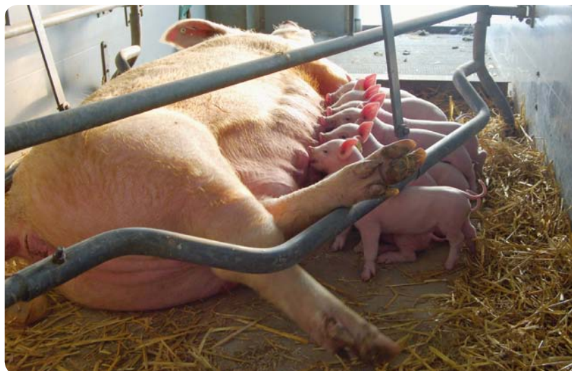
Doordat de zeugen meer ruimte hebben, kunnen ze bijvoorbeeld zij- of achterwaarts in de kraambeugels gaan liggen.